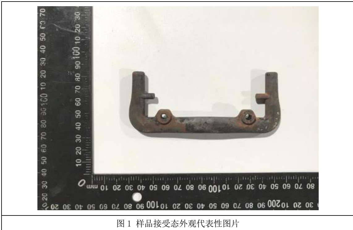
图 1 样品接受态外观代表性图片